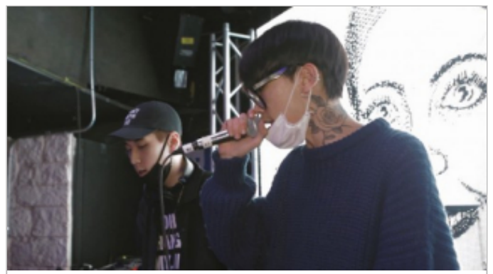
'K팝 넘은 음악'...XXX, 美 SXSW 화려한 출격