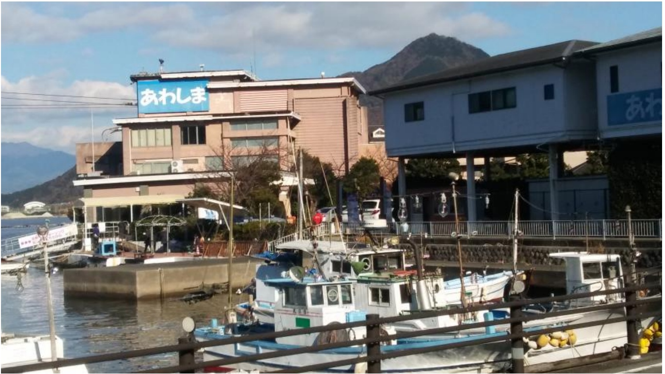
여관에서 누마즈 방향으로 약 20분 걸어가면 이렇게 생긴 파란간판이 나온다. 버스정류장으로는 마린파크역까지 걸어가면된다. 이제 아와시마 마린파크로 들어가기 위해 표를 구입한다. 배표 요금은 왕복 1800엔이고 수족관,개구리관,돌고래쇼를 포함한 가격이다