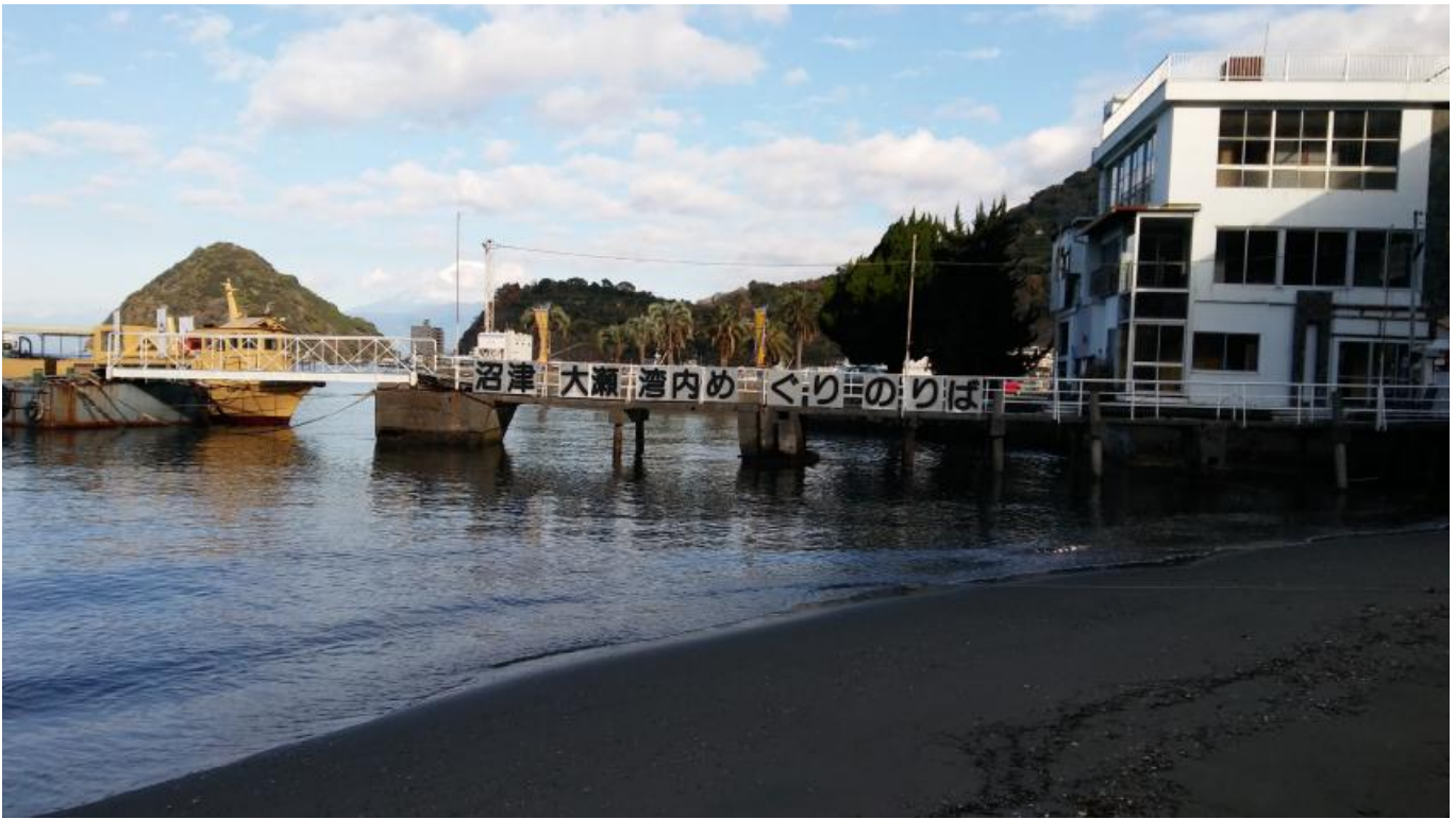
여관 바로앞에서 아쿠아즈라고 모래사장에 적어보고 1화에서 리코가 뛰어내린 선착장도 찰칵