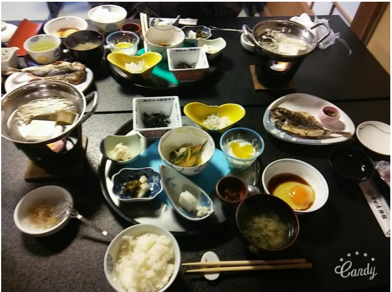
여관아침식사(객실요금에 포함임) 역시 해산물 종류가 많지만 해산물 극혐인 나도 맛있게 먹을 정도로 맛있었다. 진심 엄마가 한 밥보다 더맛있음ㅎㅎ