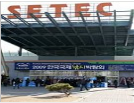
2009한국국제빛사박람회 관람후기 1/2 (스크롤 압박)