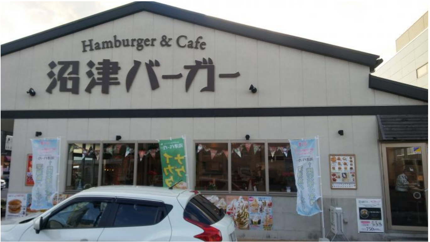
누마즈역에서 어서 약 30분이면 누마즈버거가 나온다 지도로 보면 좌우회전 필요없이 오직 한길로 쭉 걸어가면 나와서 길찾기가 쉽다