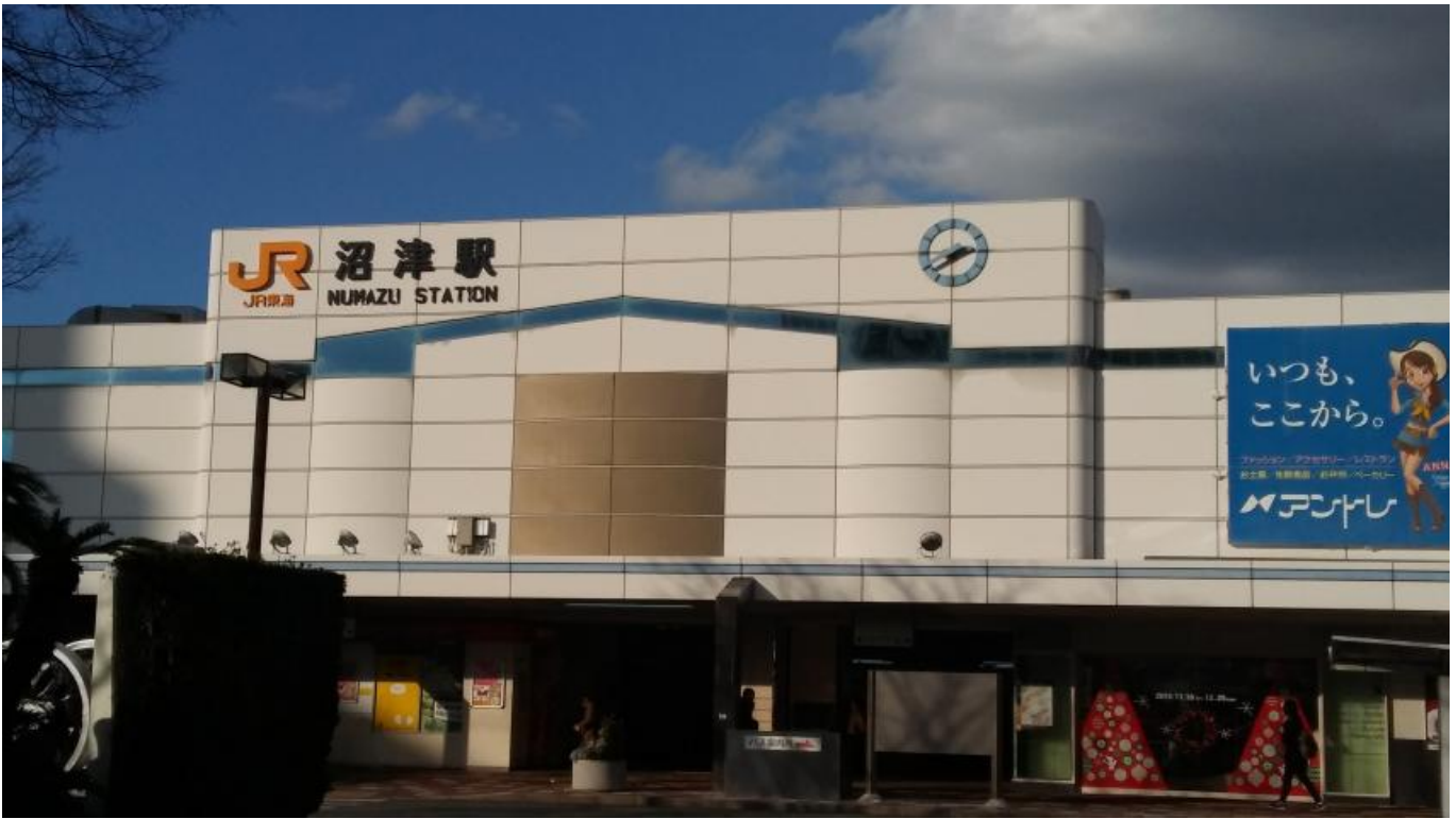
누마즈역에 도착 남쪽출구 북쪽출구가 있는데 북쪽으로 나가면 남쪽으로 다시 돌아오기 귀찮다고 이야기 들어서 쿨하고 북쪽 성지순례는 포기했다. (실은 누마즈행 열차 한번 놓쳐서 시간 엄청 잡아먹음)