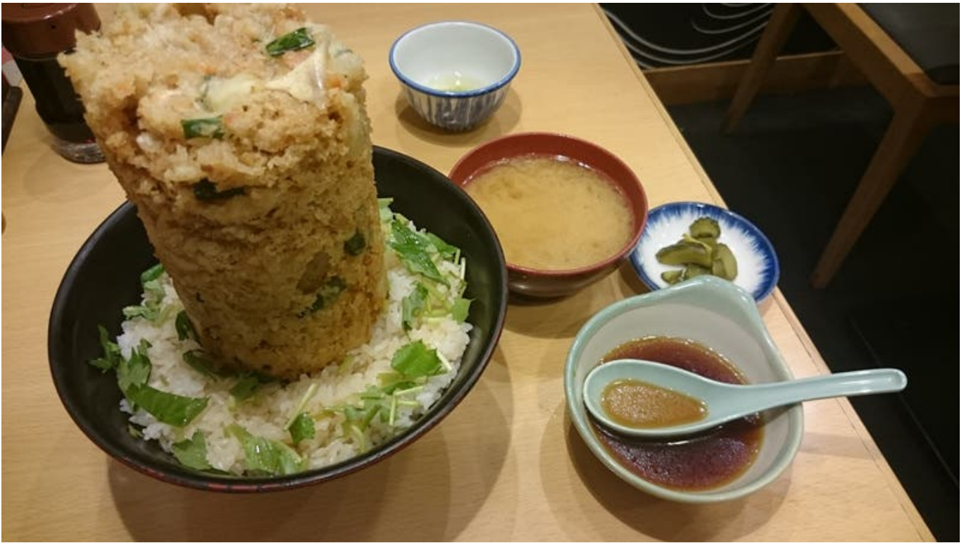
이 거대한 텐동을 파는 곳은 누마즈항 근처의 '魚河岸丸天' 임 구글 지도에 검색하면 나옴. 난 그 날 아침 이후 첫끼였는데 먹다가 느끼해서 기브업했음. 가격은 1188엔.