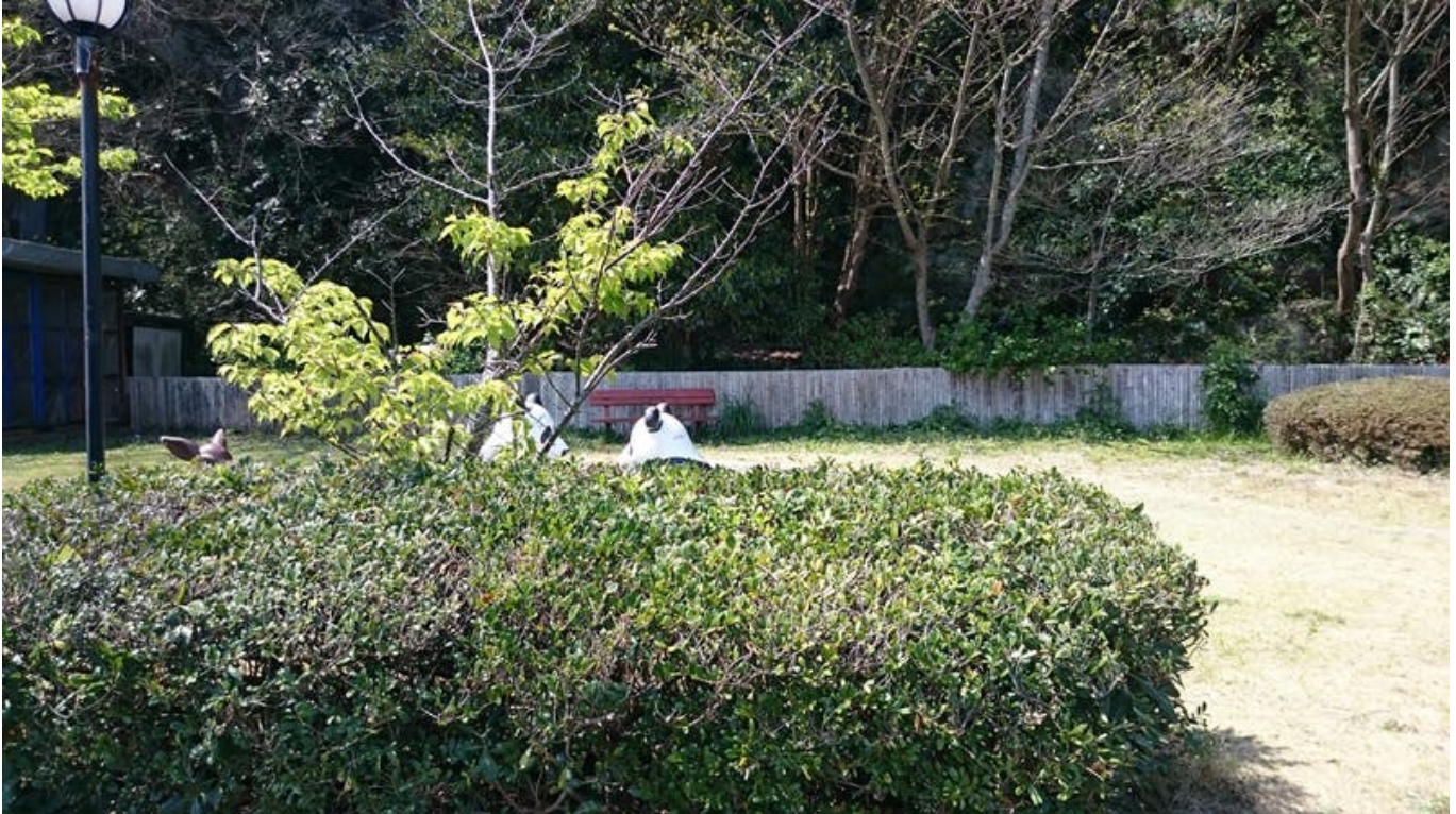
팬더 앞에서 그 후 아와시마 신사 올라가는 길 나오는데 절대 올라가지 마길....비추...시간낭비임 ㅠㅠ