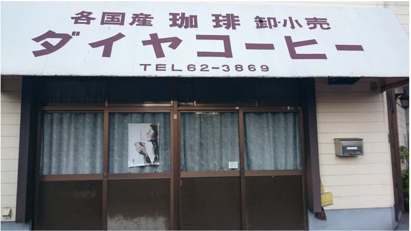
아침 일찍 일어나서 7시부터 자전거를 타고 누마즈 시내를 돌았음. 다이야 커피는 따로 지도에 없기 때문에 지도에 검색하길.