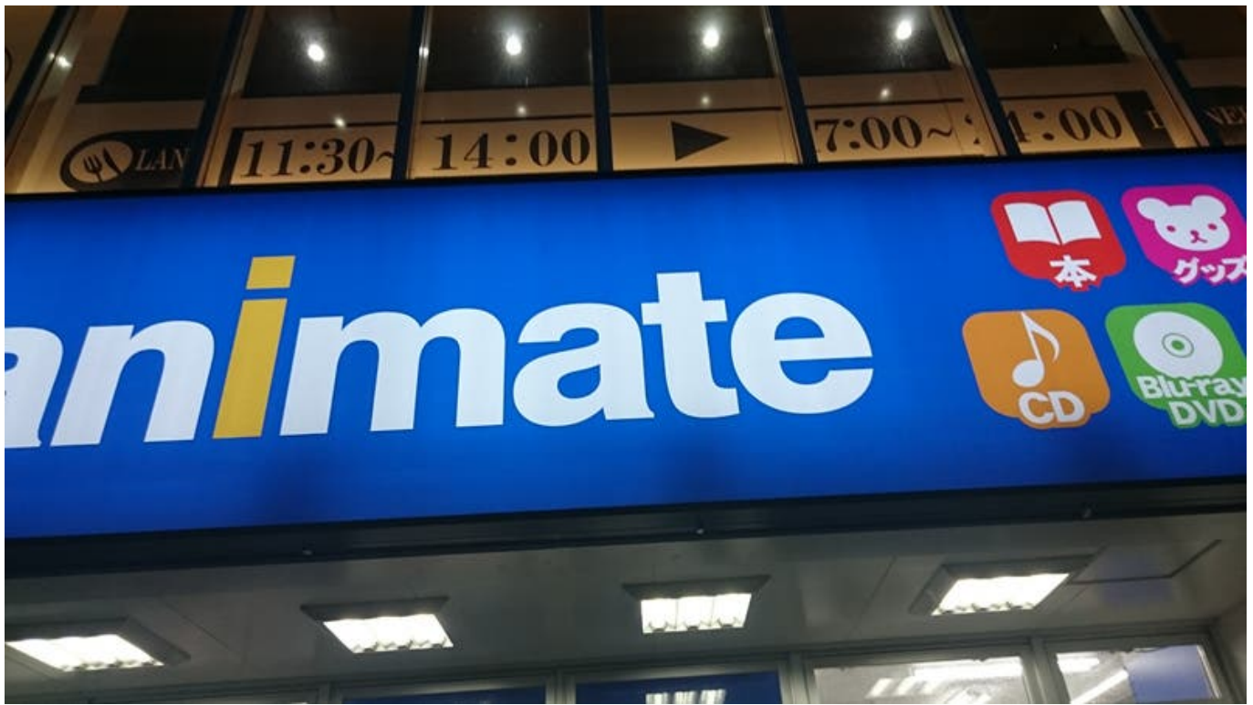
아니메이트에서 조금만 더 가면 게이머즈임. 솔직히 게이머즈가 볼게 더 많음 ㅎㅎ