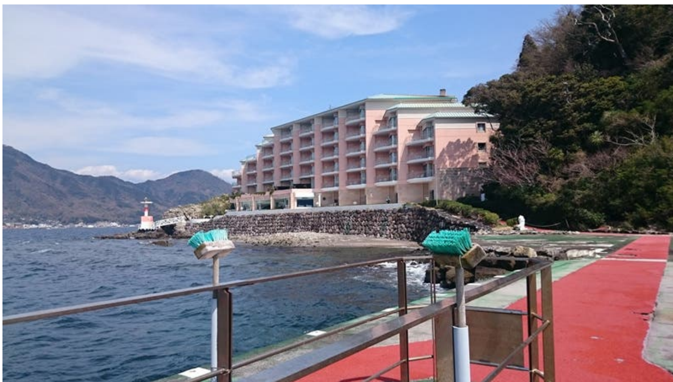
아와시마 호텔 사유지는 못들어가는데 여긴 들어갈 수 있음 〇〇 터널 건너임