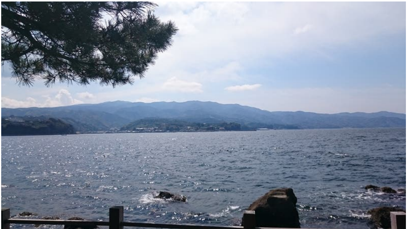
터널 건너서 쪽 섬위 뒷쪽으로 건다보면 나옴. 공홈 뒷배경.