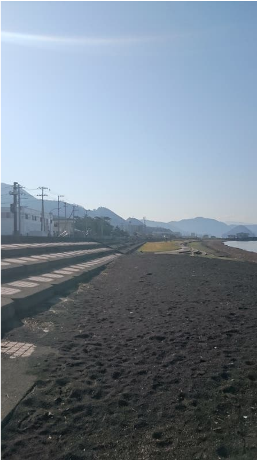
다이야가 노래 연습하는 곳?