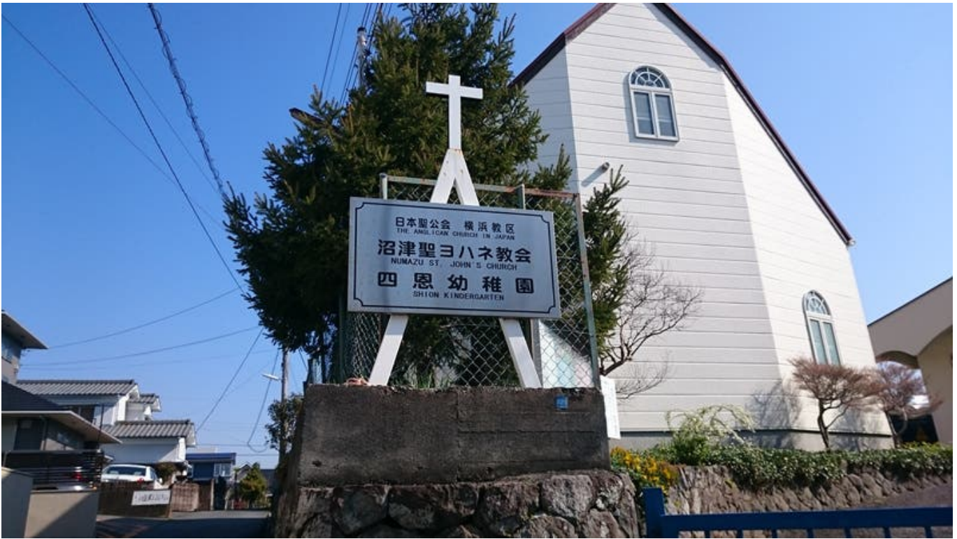
성 요하네 교회. 들어가는 못하고 앞에서만 사진 찍음. 여기서 지도에는 마크가 안되어있어서 그냥 지도에서 찾아가는게. 이 교회가 역이랑 가까워서 바로 숙소 들러서 체크아웃하고 누마즈역 앞에 코인라커에 캐리어랑 가방 처박고 아까 위해서 말한 아와시마 마린팩을 샀음.